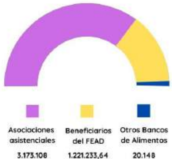
ALIMENTOS RECIBIDOS EN 2020