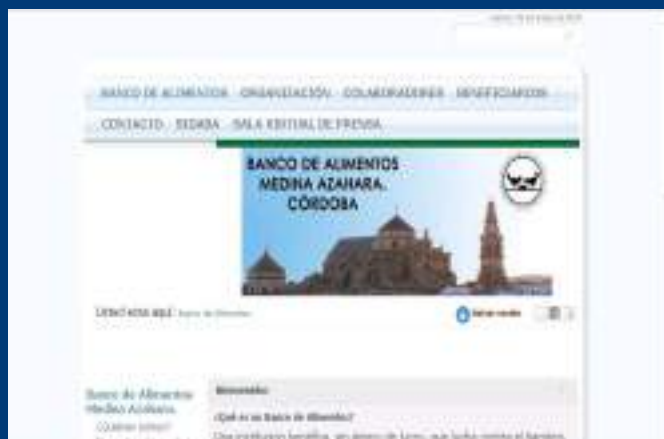
Portada de la página WEB