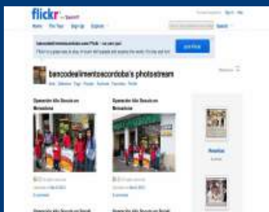
Banco de imágenes en FLICKR