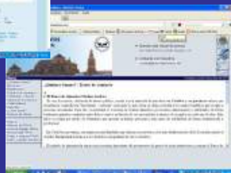
Portada de la página WEB