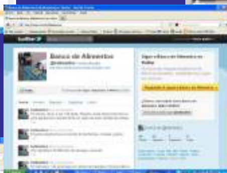
Página de Twitter