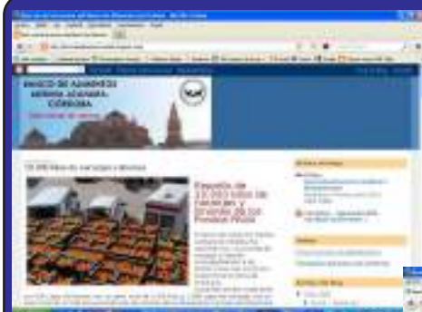
Blog Oficina Virtual de Prensa

Por otra parte la WEB del Banco de Alimentos esta siendo totalmente reformado ofreciendo una mayor claridad y operatividad de funcionamiento siendo un enlace para las actividades de la institución,