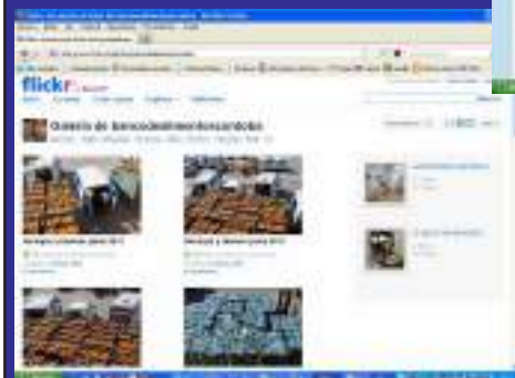
Banco de imágenes en FLICKR