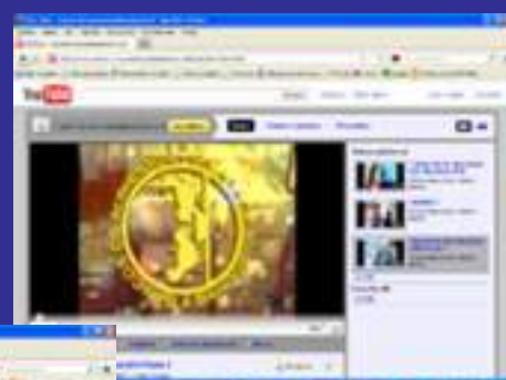
Videos en You Tube